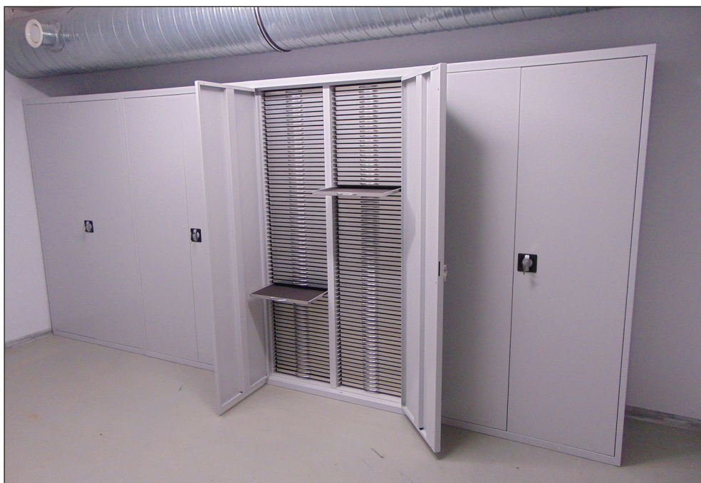
Ryc. 21. Szafy zakupione do skarbca magazynu archeologicznego MAH w Stargardzie w ramach realizacji kolejnego etapu prac Adaptacja pomieszczeń gospodarczych budynku szkolnego na magazyn muzealny zabytków archeologicznych . Cz. 6, wg stanu z 27 listopada 2019 r.

W 2019 r. A. Bierca i P. Tarnawski z DHiBnSL zrealizowali kolejny, szósty etap prac (realizowanych od 2014 r.) w powstającym magazynie archeologicznym MAH w Stargardzie na osiedlu Zachód, w pomieszczeniach gospodarczych Szkoły Podstawowej nr 11. Zrealizowany został projekt Adaptacja pomieszczeń gospodarczych budynku szkolnego na magazyn muzealny zabytków archeologicznych MAH w Stargardzie . Cz. 6 dofinansowany ze środków Ministra Kultury i Dziedzictwa Narodowego w Warszawie (ryc. 21).