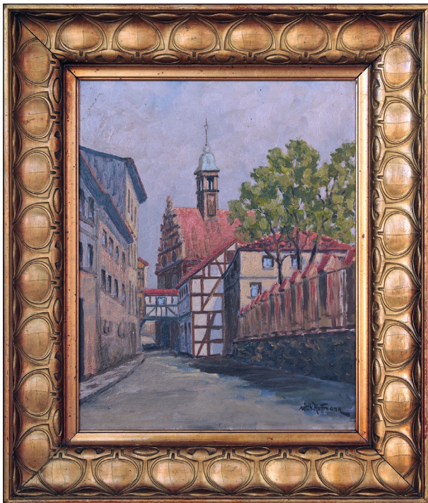
Ryc. 12. Obraz autorstwa Wilhelma Hoffmanna (1897–1986) przedstawiający romantyczny zaulek przy Bramie Wałowej w Stargardzie.