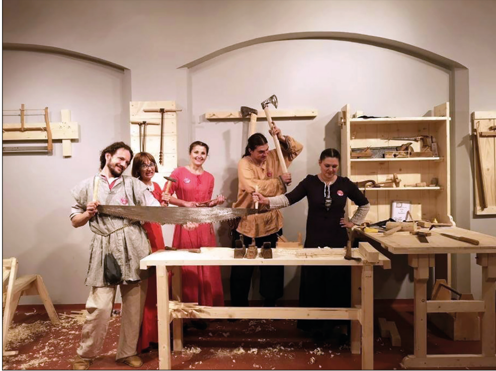
Ryc. 28. Budowlana Noc Muzeów.