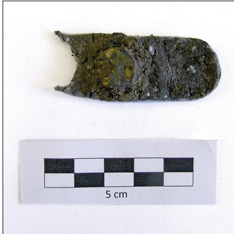
Ryc. 6. Stargard, Stare Miasto, kwartał XXVIII. Fragment paska z aplikacją – stan przed konserwacją.