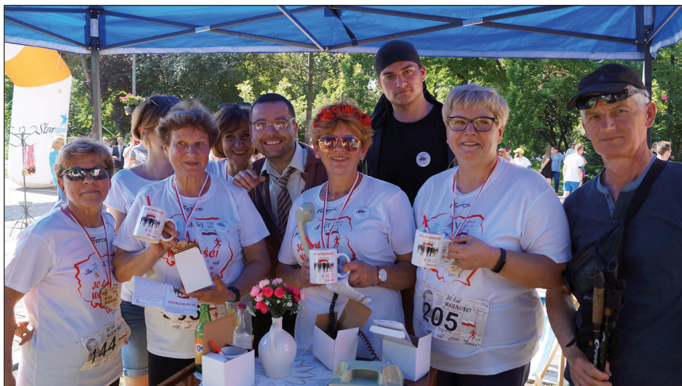
Ryc. 29. Festyn 30 lat wolności i quest miejski.

przygotował dwa wydarzenia: II Quiz Gryfa oraz grę miejską 777 kroków . Quiz, z powodu złej pogody i braku wystarczającej liczby zgłoszeń nie odbył się w otoczeniu Bastei i został przeniesiony do Internetu – za pośrednictwem narzędzia Formularze Google. Udział wzięło 17 osób, a nagrodzone zostały 3 osoby, które udzieliły najwięcej poprawnych odpowiedzi. W grze miejskiej udział wzięło 11 drużyn.