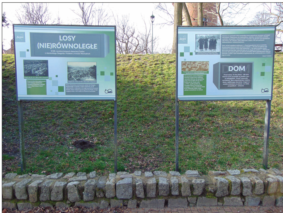
Ryc. 15. Fragment wystawy plenerowej Losy (nie)równoległe. W 80. rocznicę lutowych deportacji Żydów z niemieckiego Stargardu i Polaków z Kresów Wschodnich autorstwa J. Aniszewskiej zlokalizowanej w parku Chrobrego w Stargardzie.

10 lutego 2020 r. w parku Chrobrego w Stargardzie pojawiła się wystawa Losy (nie)równoległe. W 80. rocznicę lutowych deportacji Żydów z niemieckiego Stargardu i Polaków z Kresów Wschodnich autorstwa J. Aniszewskiej. Była to historia stargardzian, którzy doświadczyli deportacji. Z jednej strony stargardzcy Żydzi, wywiezieni z Pomorza w nocy z 12 na 13 lutego 1940 r., z drugiej strony polskie rodziny, zesłane na Syberię i do Kazachstanu 10 lutego 1940 r., dla których po powrocie z deportacji Stargard stał się nowym domem. Ekspozycja składająca się z 14 tablic opowiadała o okolicznościach tych deportacji oraz losach deportowanych podczas II wojny światowej, zawierała także wspomnienia świadków historii. W wystawie wykorzystano materiały ze zbiorów Archiwum Państwowego w Lublinie, Biblioteki Akademii Pomorskiej w Słupsku, Heimatkreis Stargard in Pommern – Elmshorn, United States Holocaust Memorial Museum w Waszyngtonie oraz Muzeum Archeologiczno-Historycznego w Stargardzie (ryc. 15).