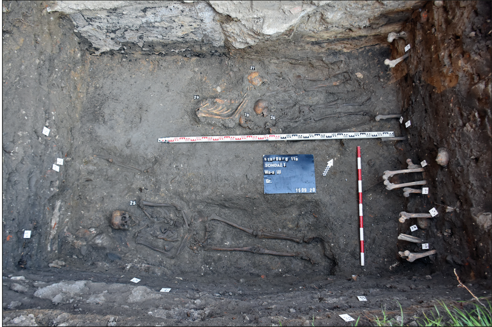
Ryc. 5. Stargard, gm. loco. Badania archeologiczne związane z odbudową oficyny kamienicy Rynek Staromiejski 3, sondaż I. Fot. M. Szeremeta

posadowienia fundamentów oficyny. Podczas badań natrafiono na część zasypanej piwnicy z kolebką, która była przedłużeniem pomieszczenia mieszczącego się pod oficyną (ryc. 5).