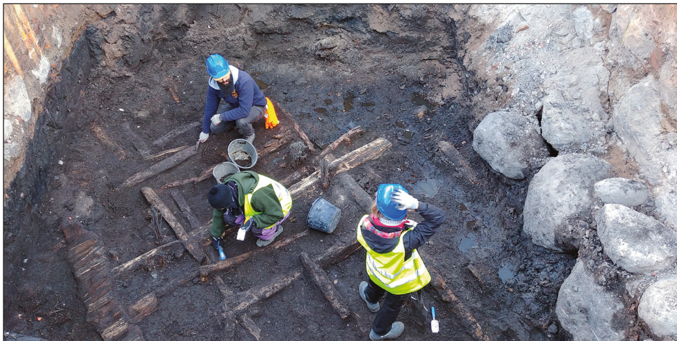
Ryc. 1. Stargard, Stare Miasto, kwartał XXIV. Badania archeologiczno-architektoniczne przy budowie Centrum Nauki przy ul. Bolesława Chrobrego 21.