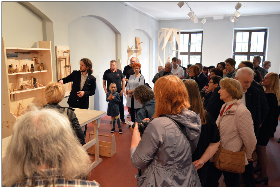
Ryc. 27. Wernisaż wystawy Dawno temu na budowie .

– Jakby to było wczoraj... – wystawa jubileuszowa autorstwa P. Jakubiak.