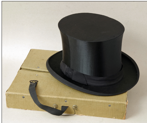
Ryc. 10. Szapoklak z zakładu kuśnierskiego Maxa Meinecke, istniejącego niegdyś przy Pyritzer Strasse 19 w Stargardzie (obecnie ul. Mieszka I), lata 20. XX w.

adresem od 1903 r. do co najmniej 1941 r. Nabyty egzemplarz wyprodukowany został prawdopodobnie w latach 20. XX w. (ryc. 10).