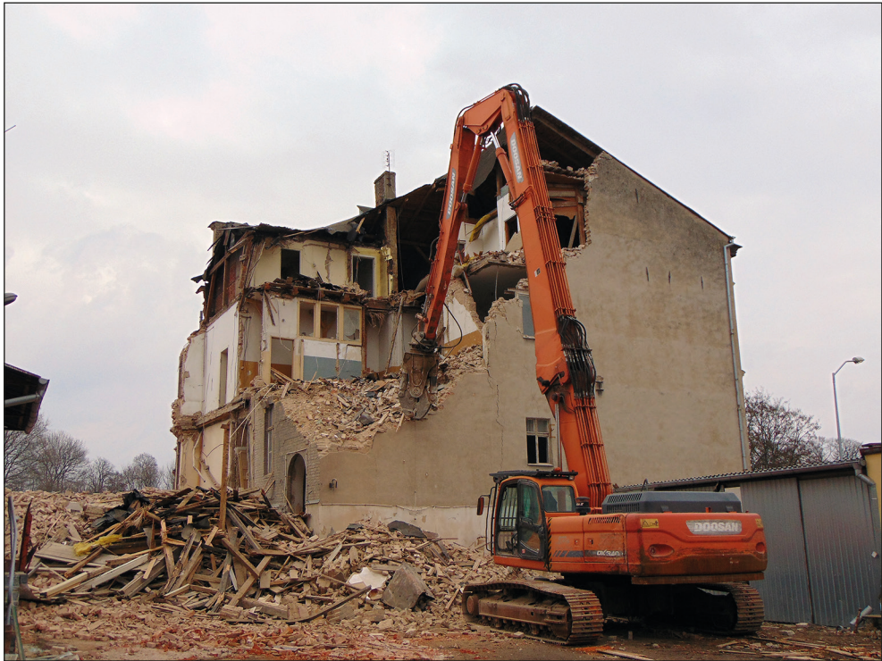
Ryc. 19. Wyburzanie kamienicy przy ul. Bolesława Chrobrego nr 21 pod budowę Stargardzkiego Centrum Nauki, wg stanu z 20 lutego 2019 r.

Zbiory fotograficzne DDZ powiększyły się o fotografie cyfrowe dokumentujące zabudowę historyczną Stargardu oraz zmiany zachodzące w miejskim krajobrazie (ryc. 20, 23–25). A. Bierca udokumentował m.in. proces rozbiórki kamienicy przy ul. Bolesława Chrobrego 21 (w miejscu której ma powstać Stargardzkie Centrum Nauki) (ryc. 19), postępy prac w powstającym magazynie archeologicznym na osiedlu Zachód, remont ul. Bolesława Krzywoustego, wewnątrz wieży kościoła św. Jana Chrzciciela, remont zakrystii kościoła Ducha Świętego, wewnątrz budynku poczty przy ul. Pocztowej. Na terenie powiatu m.in. miejscowości: Dobrzany, Kobylanka, Kunowo, Ognica, Sierakowo, Szadzko i Tarnowo.