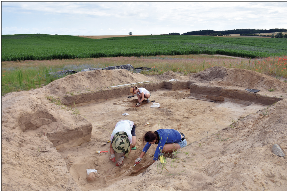
Ryc. 3. Żelewo, gm. Stare Czarnowo. Badania ratownicze zlecone przez WUOZ w Szczecinie