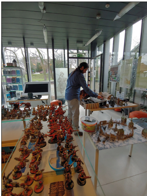
Ryc. 32. Ferie z grami bitewnymi.