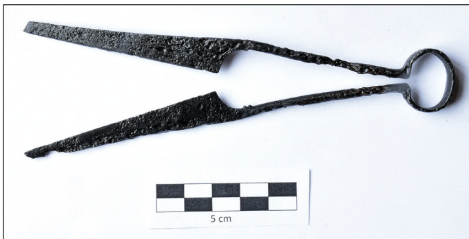
Ryc. 9. Stargard, Stare Miasto, kwartał XXVI. Nożyce – stan po konserwacji.