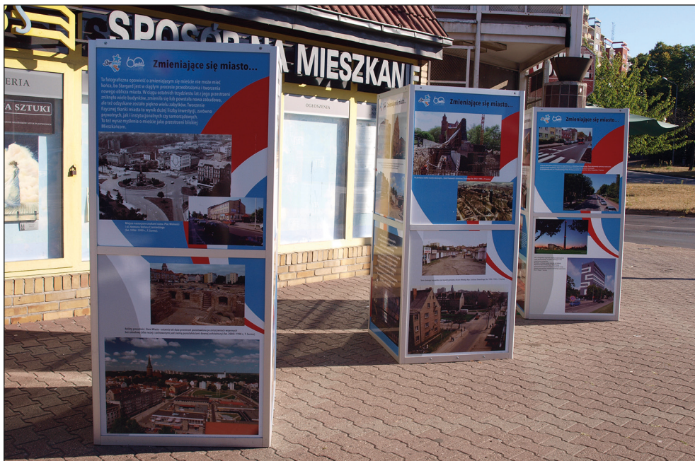
Ryc. 16. Wystawa plenerowa Zmieniające się miasto... usytuowana przy ul. Kard. Stefana Wyszyńskiego w Stargardzie.