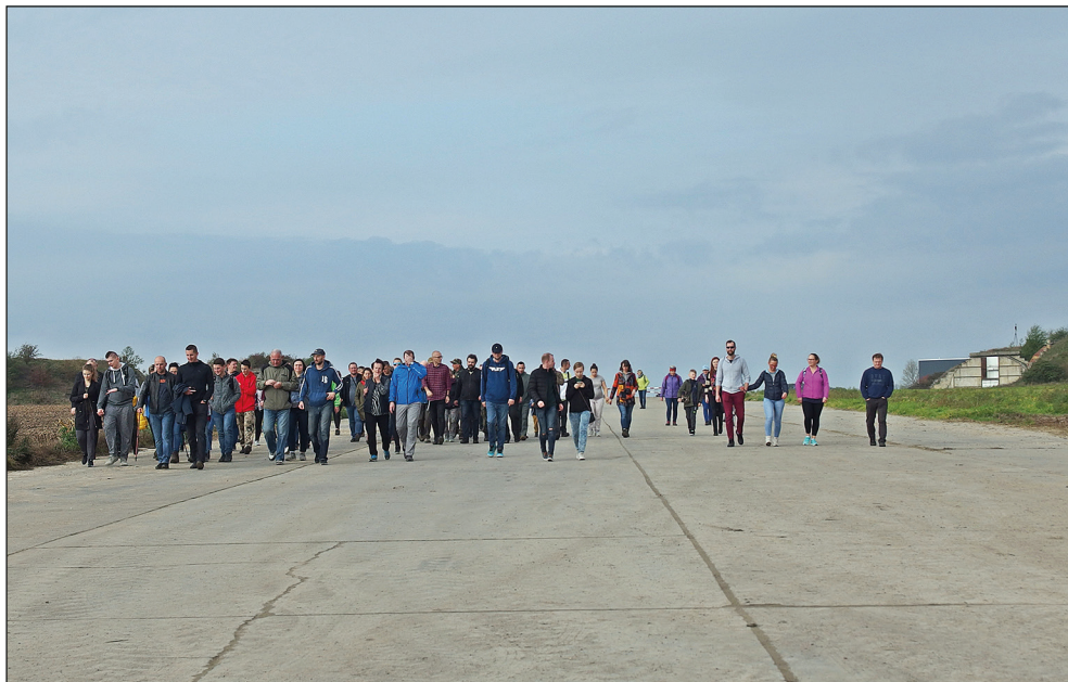
Ryc. 22. Uczestnicy terenowego rajdu pieszego na trasie: Kluczewo – Burzykowo – Slotnica – Kluczewo (po byłym lotnisku wojskowym), w ramach jubileuszu 60-lecia funkcjonowania Muzeum Archeologiczno-Historycznego w Stargardzie, 13 października 2019 r.