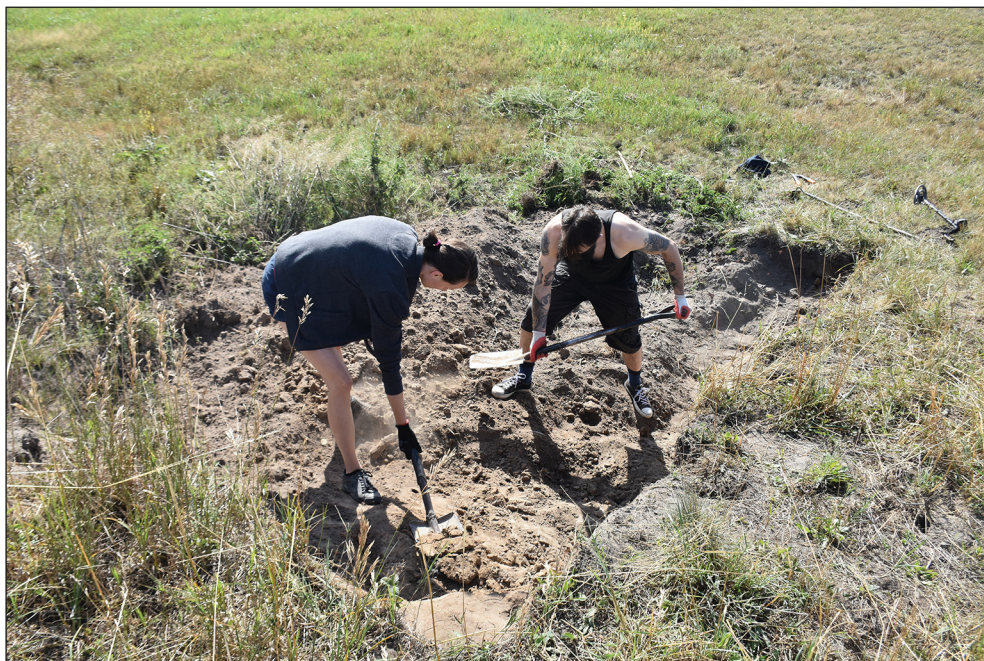
Ryc. 4. Kurcewo, gm. Stargard. Badania archeologiczne na wczesnośredniowiecznym grodzisku nizinnym z podgrodzium – wpisanym do rejestru zabytków pod nr 588, dec. KL.1.6801/20/68

Na wspomnianym terenie przeprowadzono już w 1968 r. badania weryfikacyjne, a w 1979 r. odwierty, które określiły stanowisko jako wczesnośredniowieczną osadę. Badania obejmowały wykonanie pięciu wykopów sondażowych na osi E–W po N stronie wybierzyska piasku oraz jednego wykopu prostopadłego do ww. linii na osi N–S w celu ustalenia granic zdewastowanego obszaru. Prace archeologiczne potwierdziły wcześniejsze ustalenia, iż obiekt jest pozostałością po osadzie datowanej na IX–XII w. a nie po wczesnośredniowiecznym grodzisku (ryc. 4).