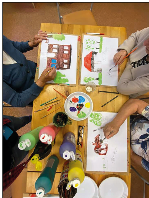
Ryc. 34. Zajęcia w Domu Dziennego Pobytu Senior +.

(ryc. 31), zaś drugim był wykład Peter Gröning i jego droga do wielkości w kolegiacie pw. NMP Królowej Świata (prowadzenie: dr hab. M. Majewski i M. Burdziej), w którym wzięło udział ponad 60 osób. EDD w roku 2020 odbyły się pod hasłem Korowód pokoleń . Wydarzenia z tej okazji przygotowane i prowadzone były przez pracowników MAH: objazd studyjny przez M. Opęchowskiego, cykl postów na profilu Facebook przygotowany przez DHiBnSL oraz wirtualna wystawa przygotowana przez DA. Pracownicy DUSEiP przygotowali dwa wydarzenia: rowerową grę miejską Korowód stargardzian (gra nie odbyła się z powodu braku odpowiedniej liczby zgłoszeń) oraz spotkanie Historie opowiedziane dźwiękiem poprowadzone przez P. Antczaka w kamienicy przy ul. Bydgoskiej 22, w którym wzięło udział 40 osób.