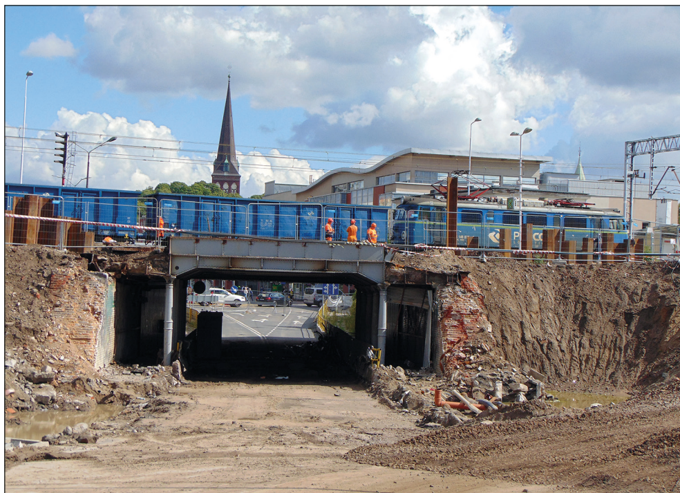
Ryc. 24. Prace rozbiórkowe i budowa nowego wiaduktu nad ul. Kard. Stefana Wyszyńskiego, wg stanu z 3 września 2020 r.