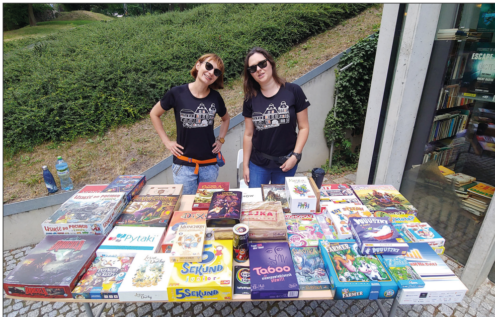
Ryc. 30. Historyczne Dni Stargardu, Spotkanie z planszówkami pod Basteją.

przygotował dwa wydarzenia: II Quiz Gryfa oraz grę miejską 777 kroków . Quiz, z powodu złej pogody i braku wystarczającej liczby zgłoszeń nie odbył się w otoczeniu Bastei i został przeniesiony do Internetu – za pośrednictwem narzędzia Formularze Google. Udział wzięło 17 osób, a nagrodzone zostały 3 osoby, które udzieliły najwięcej poprawnych odpowiedzi. W grze miejskiej udział wzięło 11 drużyn.