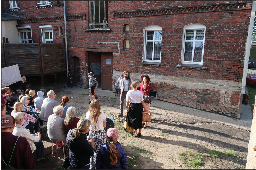
Ryc. 31. Spektakl Szepty starej kamienicy zorganizowany w ramach Europejskich Dni Dziedzictwa.