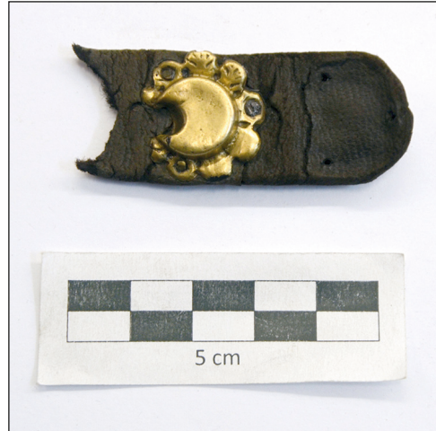
Ryc. 7. Stargard, Stare Miasto, kwartał XXVIII. Fragment paska z aplikacją – stan po konserwacji.