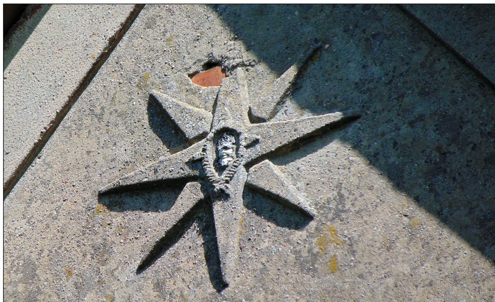
Ryc. 25. Element solarny w szczytowej partii budynku przy ul. Grunwaldzkiej, wg stanu z 2 czerwca 2020 r.