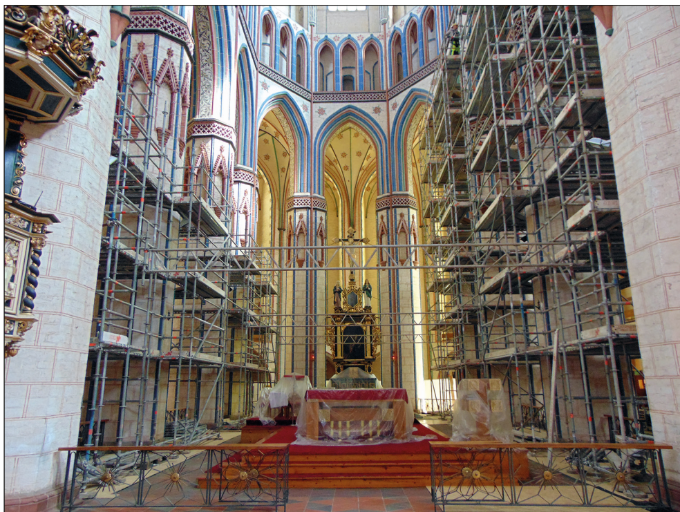
Ryc. 23. Kościół Mariacki, prace renowacyjne, wg stanu z 28 kwietnia 2020 r.