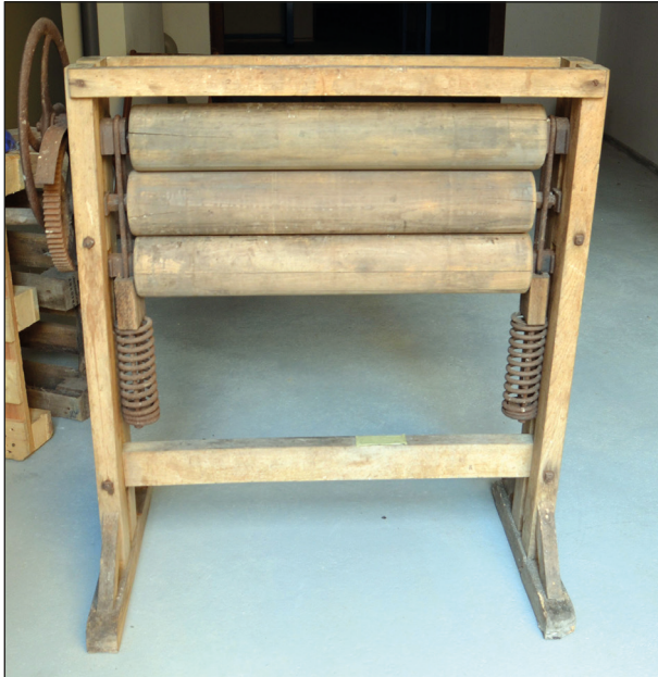
Ryc. 11. Magiel ze stargardzkiej firmy Fritza Rüngera, zlokalizowanej przy Johannisstrasse 14 (ul. Bolesława Chrobrego) w Stargardzie, lata 30. XX w.