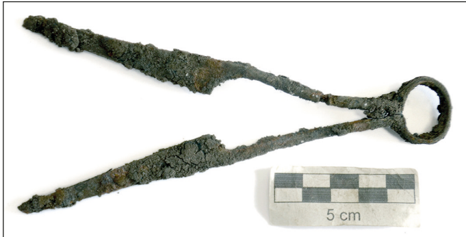
Ryc. 8. Stargard, Stare Miasto, kwartał XXVI. Nożyce – stan przed konserwacją. Fot. K. Sturm