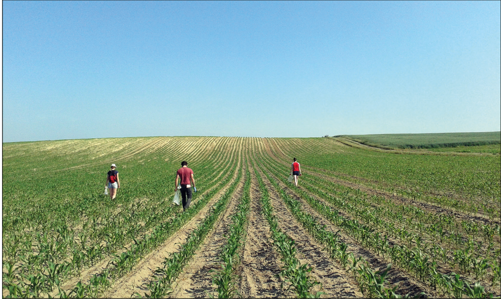
Ryc. 2. Żelewo, gm. Stare Czarnowo. Badania powierzchniowe zlecone przez WUOZ w Szczecinie.