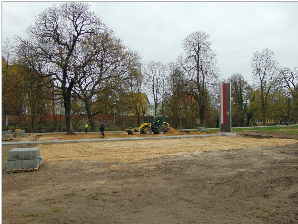
Ryc. 20. Prace przy aranżacji otoczenia przy pomniku patriotycznym „Stargardzianie – Ojczyźnie w setną rocznicę odzyskania niepodległości”, wg stanu z 11 kwietnia 2019 r.