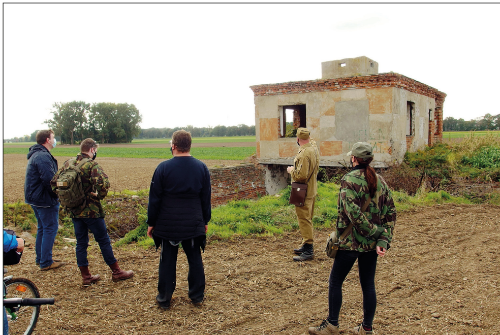
Ryc. 26. Terenowy rajd pieszy Kluczewo 2020 , po byłym lotnisku wojskowym Luftwaffe i Armii Radzieckiej w ramach Europejskich Dni Dziedzictwa w 2019 r., 11 października 2020 r.